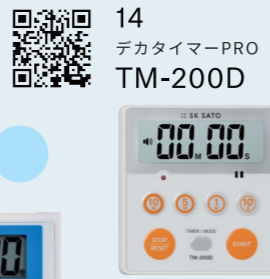
14 デカタイマーPRO TM-200D