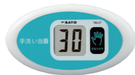
▲ ノータッチタイマー® 手洗い当番 TM-27