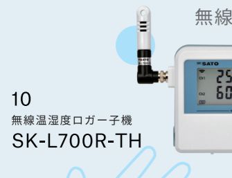
10 無線温湿度ロガー子機 SK-L700R-TH