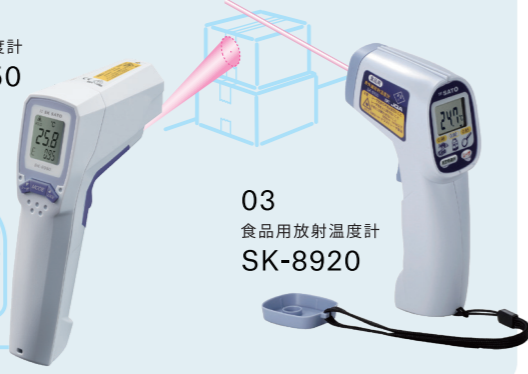
03 食品用放射温度計 SK-8920