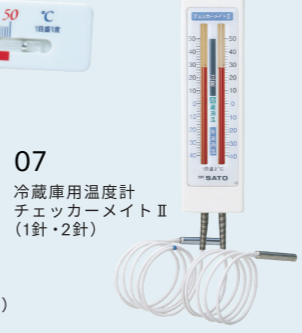
07 冷蔵庫用温度計 チェッカーメイトII (1針・2針)