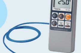
17 防水型デジタル温度計 (真空調理用センサ付き) SK-1260