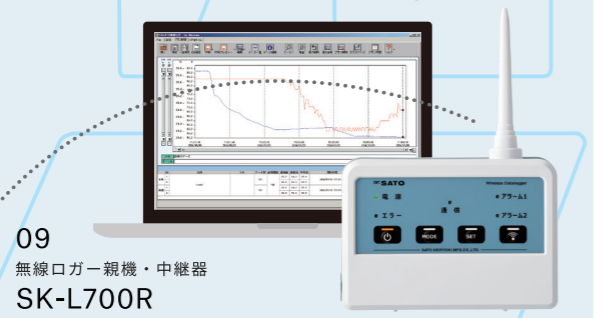
09 無線ロガー親機・中継器 SK-L700R