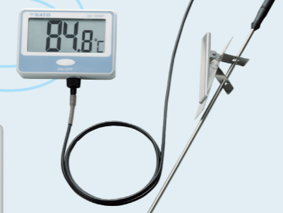
19 壁掛型防水 デジタル温度計 SK-100WP