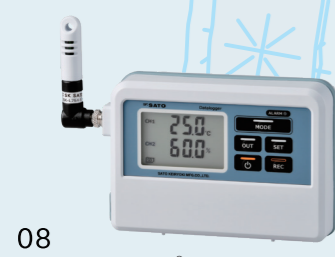
08 データロガー記憶計 ® (温湿度) SK-L754