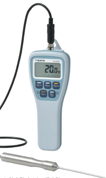
▲ 防水型デジタル温度計 SK-270WP