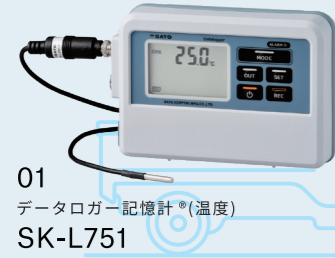
01 データロガー記憶計 ® (温度) SK-L751