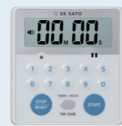
15 デカタイマーPRO TM-250B